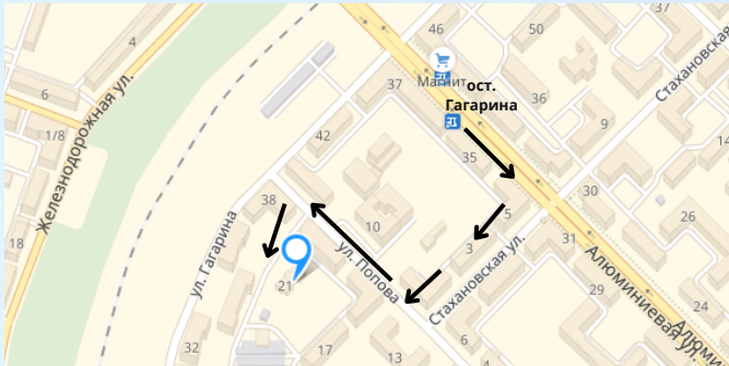
Схема маршрута от ост. Гагарина до Реабилитационного центра

От железнодорожного/автовокзала можно доехать на автобусах №9 и №16 до ост. Гагарина