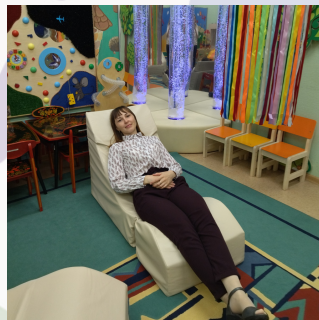
Оборудование сенсорной комнаты