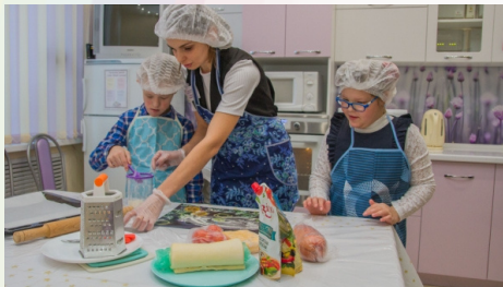
Жилой модуль "Кухня"

Юридическая помощь родителю/законному представителю в целях защиты прав и законных интересов -юрист-консультант Консультация врача-невролога (по показаниям)