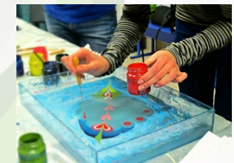
Техника Эбру- рисование на воде

Программно-аппаратный комплекс "Муза" -интерактивное пространство для творчества. Монтаж фильма с 3D анимацией и озвучкой, создание и иллюстрирование интерактивной книги, многофункциональный редактор для создания картин и персонажей