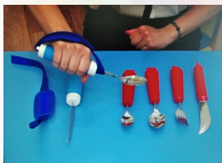
Специальная посуда для детей с нарушениями опорно-двигательного аппарата