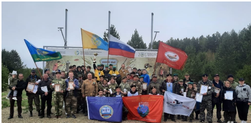
В завершении соревнования общее фото на память

Сегодня, когда патриотическое воспитание подрастающего поколения приобрело особо важную значимость, военно – спортивные соревнования, направленные на формирование и развитие физических и духовных качеств детей особенно актуальны.