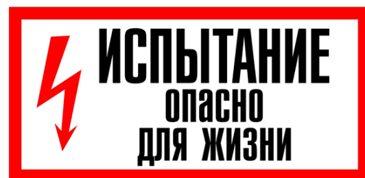
Знак «Испытание опасно для жизни»

Предупреждающий плакат, информирующий об опасности приближения к участку электроустановки, на которой размещается данное средство защиты.