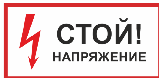
Знак «Стой Напряжение»

Предупреждающий плакат, информирующий об опасности приближения к участку электроустановки, на которой размещается данное средство защиты.