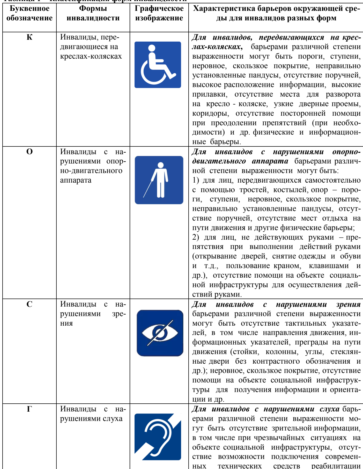
Таблица 1 – Классификация форм инвалидности

Для решения вопросов создания доступной среды жизнедеятельности на объектах социальной инфраструктуры разработана классификация форм инвалидности, которую условно можно обозначить «пентада коску» 2 . В зависимости от формы инвалидности лицо сталкивается с определенными барьерами, мешающими ему пользоваться зданиями, сооружениями и предоставляемыми населению услугами наравне с остальными людьми.