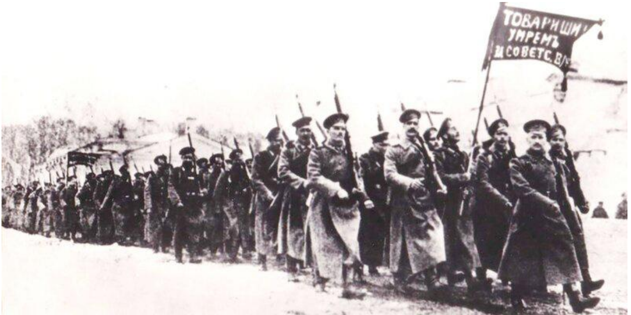
Отряд Псковских красногвардейцев. 1918 год.

23 февраля наша страна отмечает День защитника Отечества. Свое нынешнее название праздник получил только в 1995 году. Предлагаем вам узнать, как возник и менялся праздник, а также какие названия носил раньше.